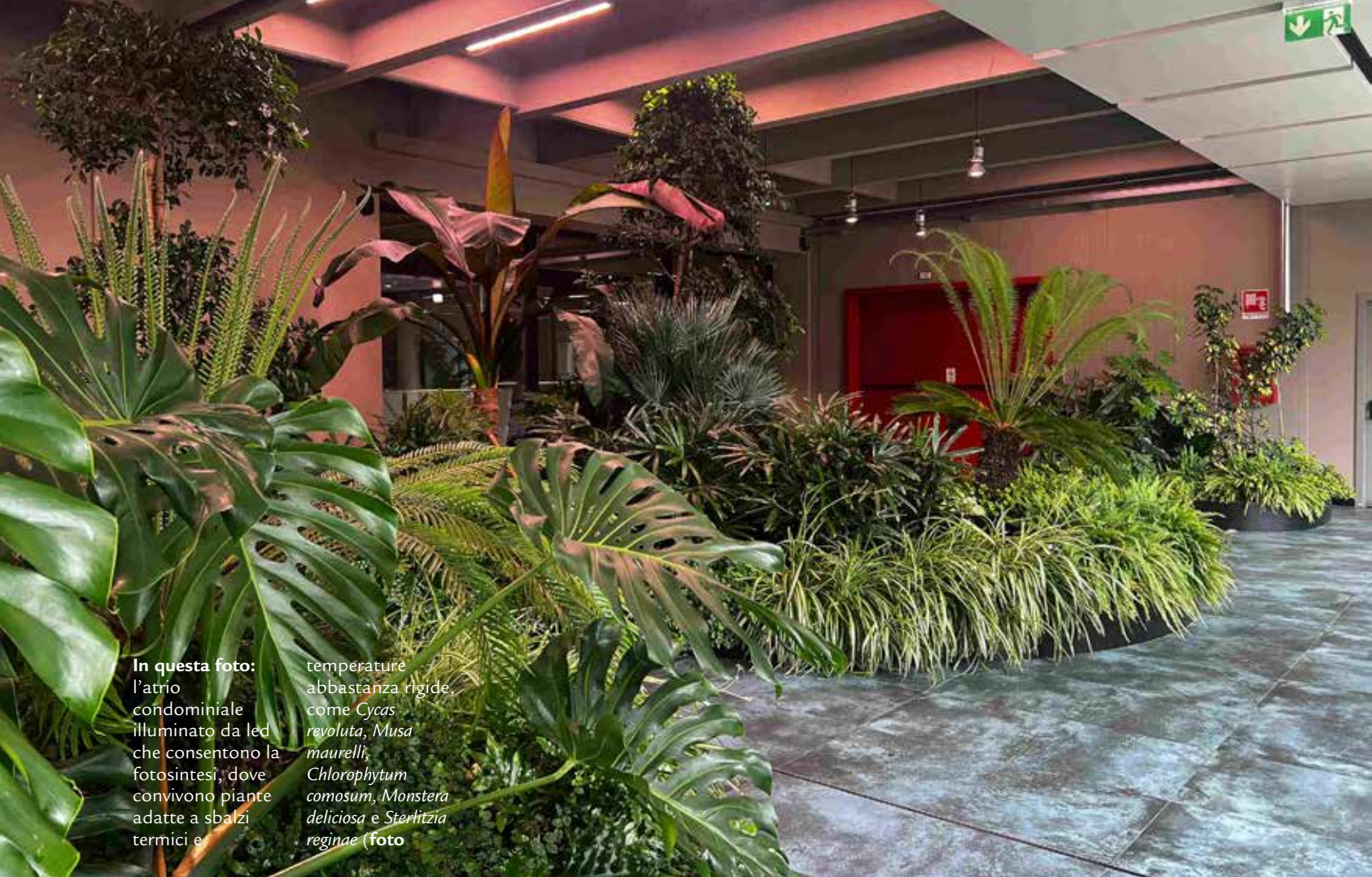
In questa foto: l'atrio condominiale illuminato da led che consentono la fotosintesi, dove convivono piante adatte a sbalzi termici e temperature abbastanza rigide, come Cycas revoluta , Musa maurellii , Chlorophytum comosum , Monstera deliciosa e Sterlitzia reginae (foto