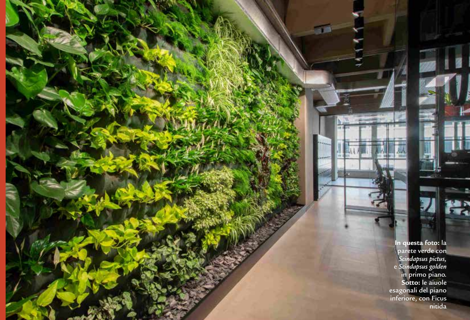
In questa foto: la parete verde con Scindapsus pictus , e Scindapsus golden in primo piano. Sotto: le aiuole esagonali del piano inferiore, con Ficus nitida