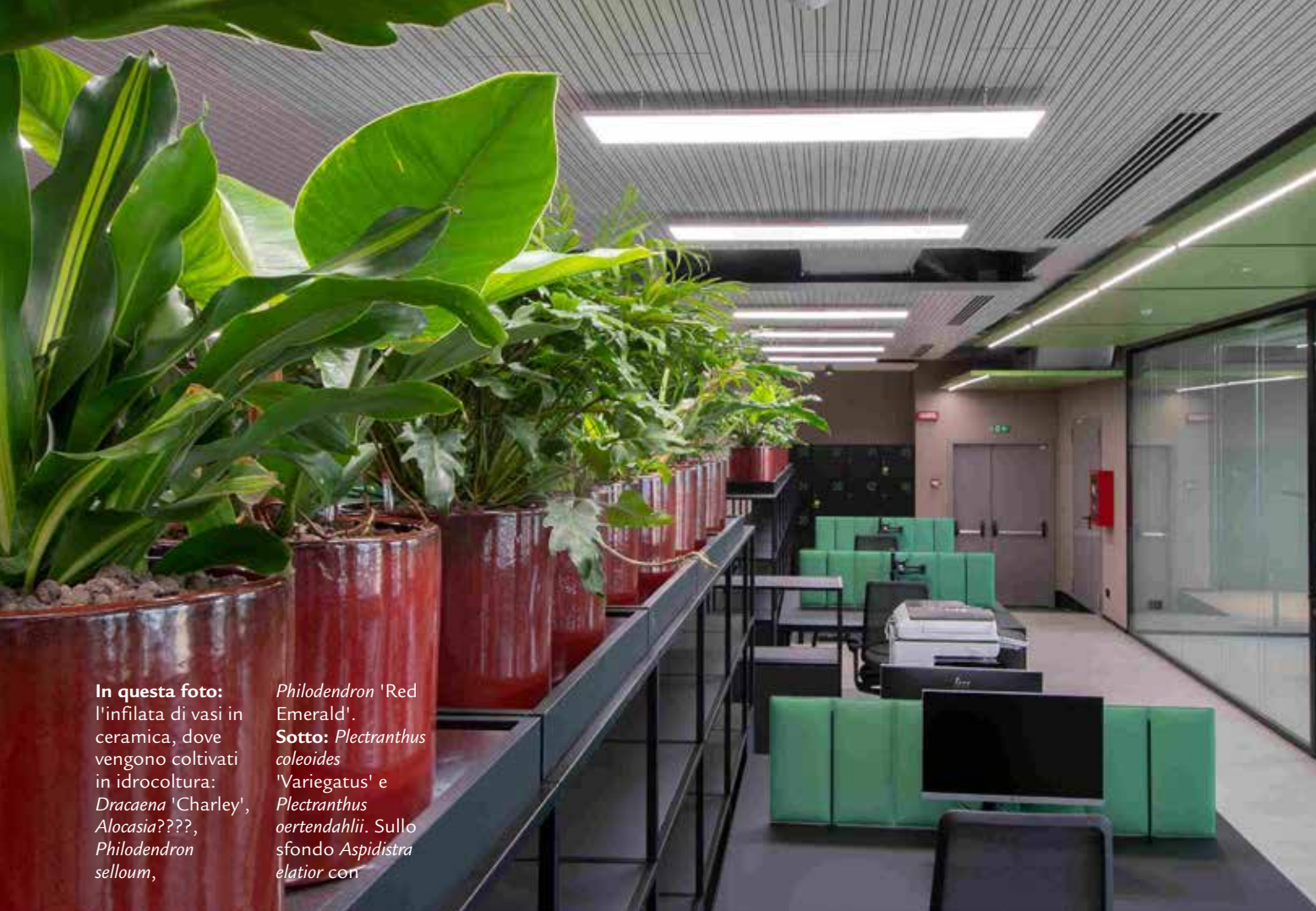
In questa foto: l'infilata di vasi in ceramica, dove vengono coltivati in idrocoltura: Dracaena 'Charley' , Alocasia ???, Philodendron selloum , Philodendron 'Red Emerald' . Sotto: Plectranthus coleoides 'Variegatus' e Plectranthus oertendahlii . Sullo sfondo Aspidistra elatior con